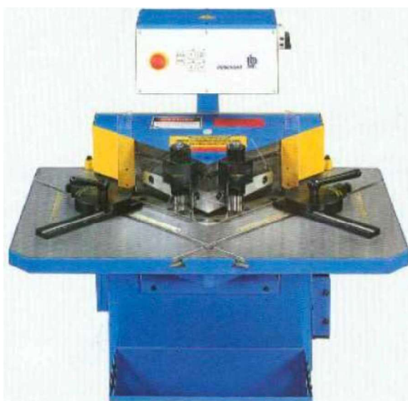
LB12/6 (LB12/4 sem grampos)

Na versão padrão, a máquina está equipada com: comando por pedal, curso ajustável, batente de cisalhamento, 3 ciclos de trabalho, batentes de precisão com escala de 300 mm e proteção em acrílico.